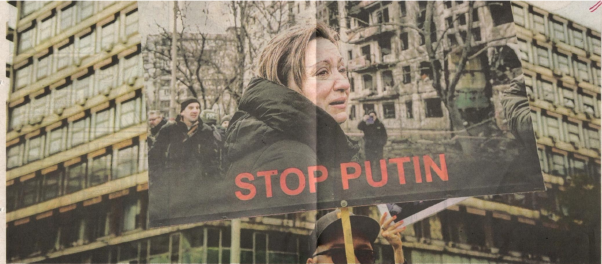
PENCEROBOHAN Rusia ke atas Ukraine dilaporkan turut mendorong peningkatan harga minyak dunia dan komoditi seperti gandum.