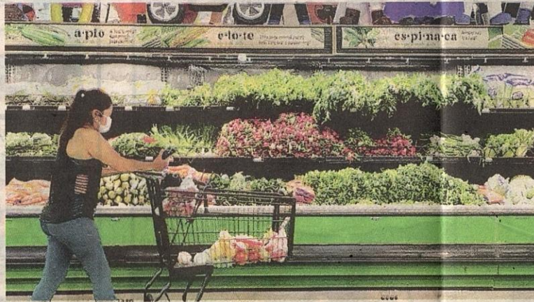
HARGA makanan di Amerika Syarikat melonjak lebih 10 peratus pada bulan lalu berbanding Mei 2021.

Harga makanan melonjak lebih 10 peratus pada bulan lalu berbanding Mei 2021, manakala kos tenaga meningkat lebih 34 peratus.